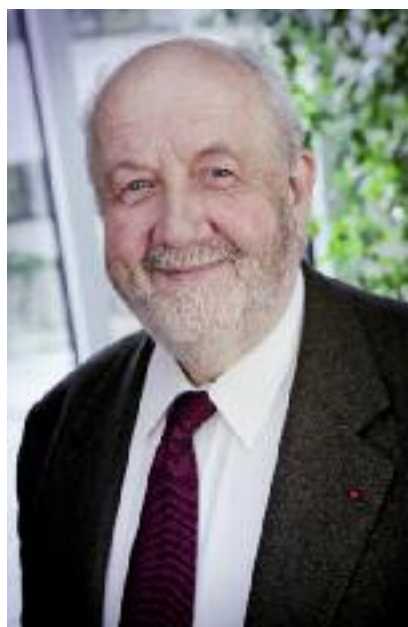
André Rossinot, président de la Communauté urbaine du Grand-Nancy